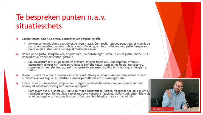
Voorbeelden PIP ( Picture in Picture) tijdens een powerpoint livestream

De kans is groot dat dit ook bij u gerealiseerd kan worden. Hiervoor is een kleine aanpassing vereist in uw bestaande raadszaal.