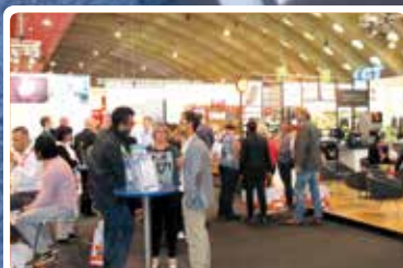
Terugblik beurs Expo 60+ in Mechelen