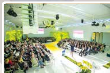
Pittige Health & Care Day