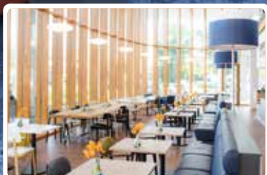
Gastvrijheid in Reinier de Graaf Gasthuis, Delft